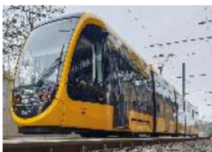
BKK járatai 1